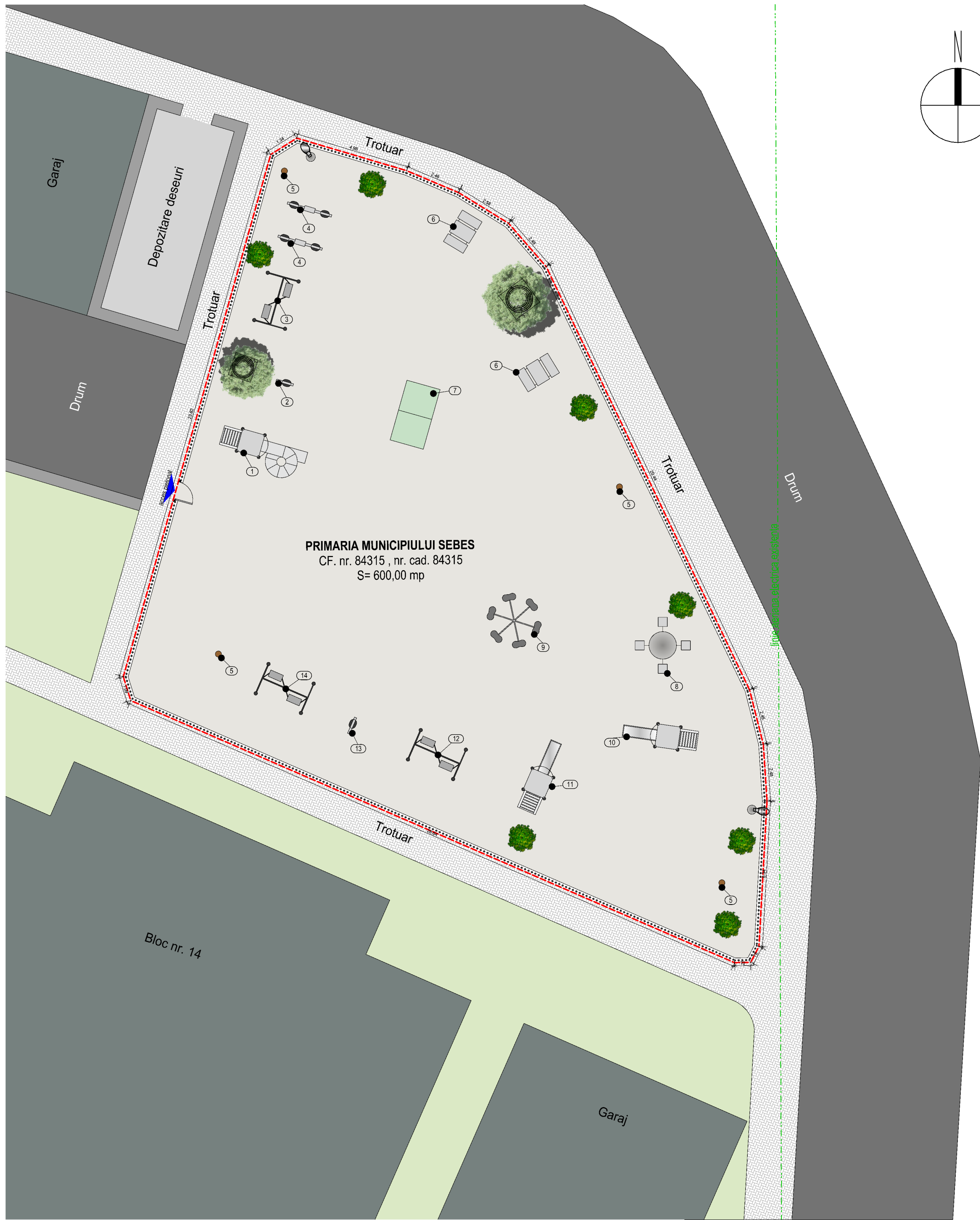
PLAN DE SITUATIE - EXISTENT - SCARA 1:150